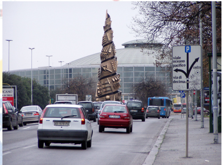
Een blik op het sportpaleis Palalottomatica

Met dank aan de sponsors die deze trip mede mogelijk maakten!